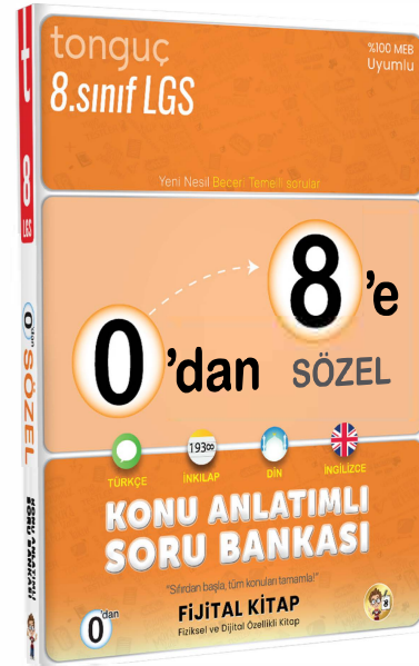
0'dan 8'e Sözel Konu Anlatımlı Soru Bankası