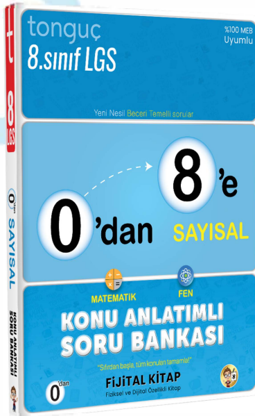
0'dan 8'e Sayısal Konu Anlatımlı Soru Bankası