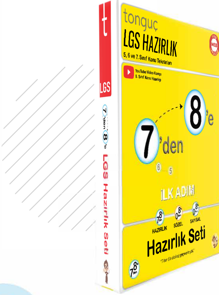
7'den 8'e İlk Adım Hazırlık Seti